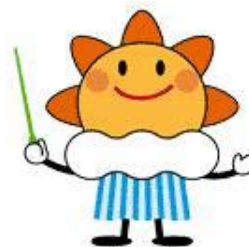
気象庁マスコットキャラクター 「はれるん」