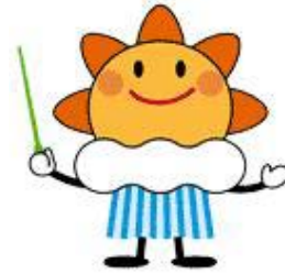
気象庁マスコットキャラクター 「はれるん」