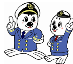
「うみまる」と「うーみん」